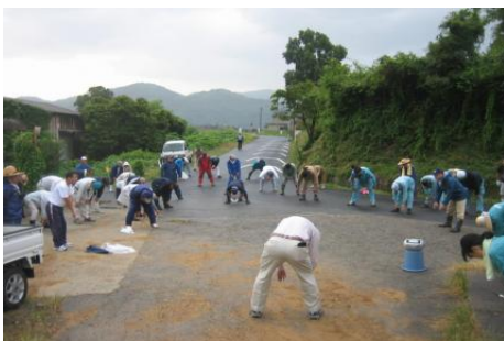
町内清掃活動の様子です