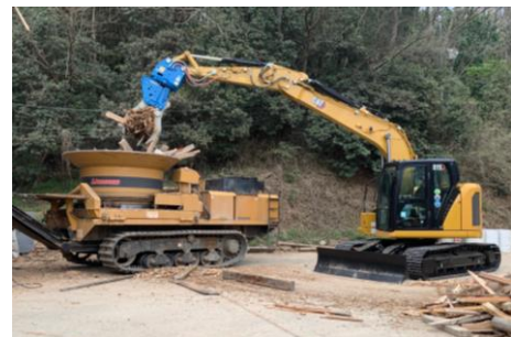
省燃費型・排ガス基準適合車