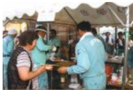
納涼祭の様子です