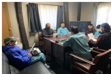
ミーティングの様子です